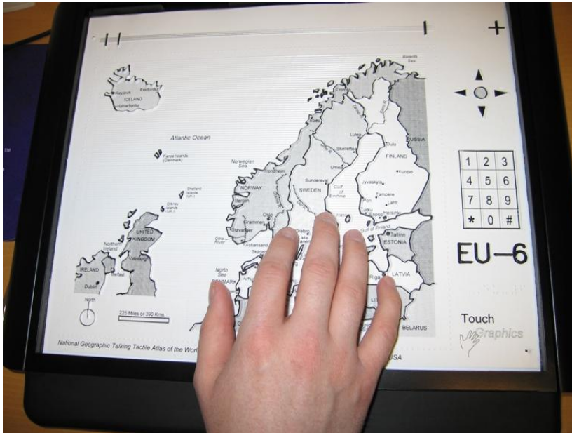
Figur 2: Bilde av fingre som trykker på kart/TTT.

I tillegg til kartene inneholder atlaset mye informasjon og en rekke funksjoner: