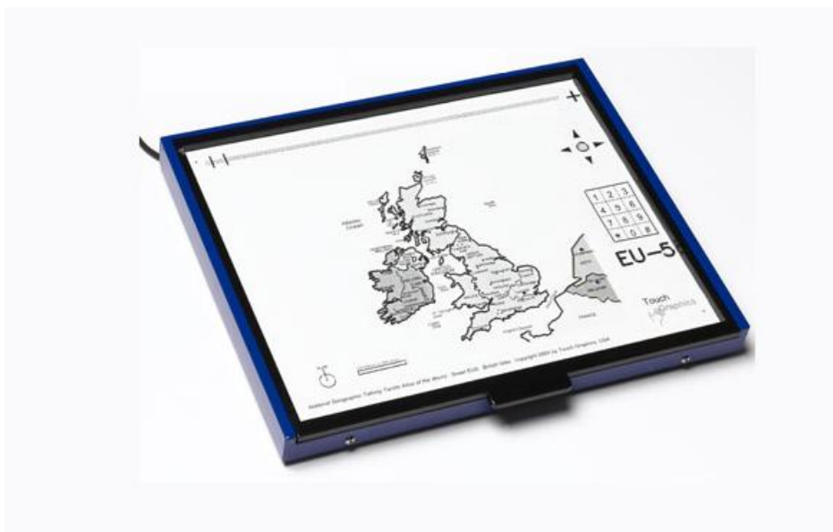
Figur 1: Produktbilde av TTT med kartark

Produktet som er utviklet består av et sett med taktile kart (totalt vil det bli ca. 70). Kartene legges på en taktil plate (TTT), som kobles til PC med en USB-kabel. Ved å trykke på kartet leses det opp informasjon, f.eks. navn på byer, land, elver, havområder osv. I prosjektet er det også utviklet et system som gjør at tale kan produseres automatisk, slik at oppdatering og videreutvikling av atlasen skal være effektivt og enkelt.